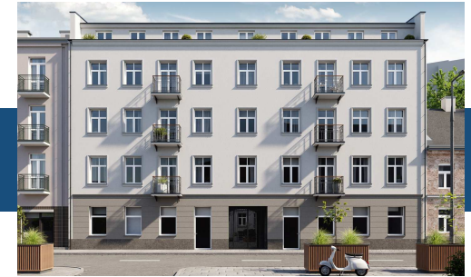
Widok budynku od strony ulicy

Nowoczesne windy, ułatwiające komunikację.