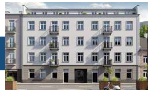
Widok budynku od strony ulicy

Nowoczesne windy, ułatwiające komunikację.