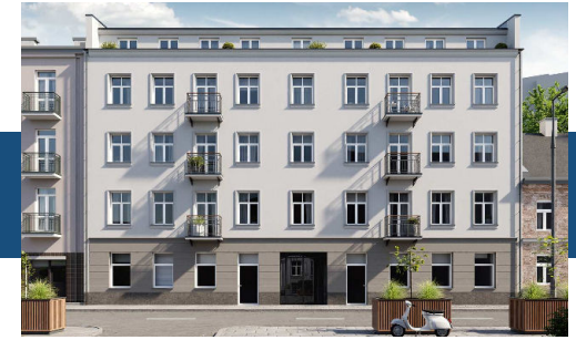
Widok budynku od strony ulicy

Nowoczesne windy, ułatwiające komunikację.