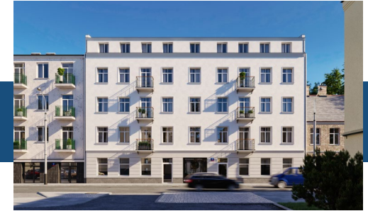
Widok budynku od strony ulicy

Nowoczesne windy, ułatwiające komunikację.