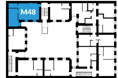
Rzut piętra II budynku