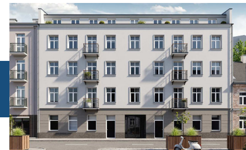
Widok budynku od strony ulicy

Nowoczesne windy, ułatwiające komunikację.