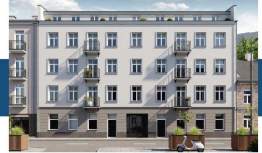
Widok budynku od strony ulicy

Nowoczesne windy, ułatwiające komunikację.