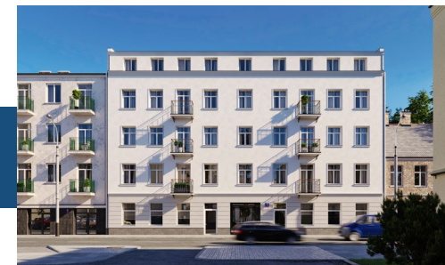
Widok budynku od strony ulicy

Nowoczesne windy, ułatwiające komunikację.