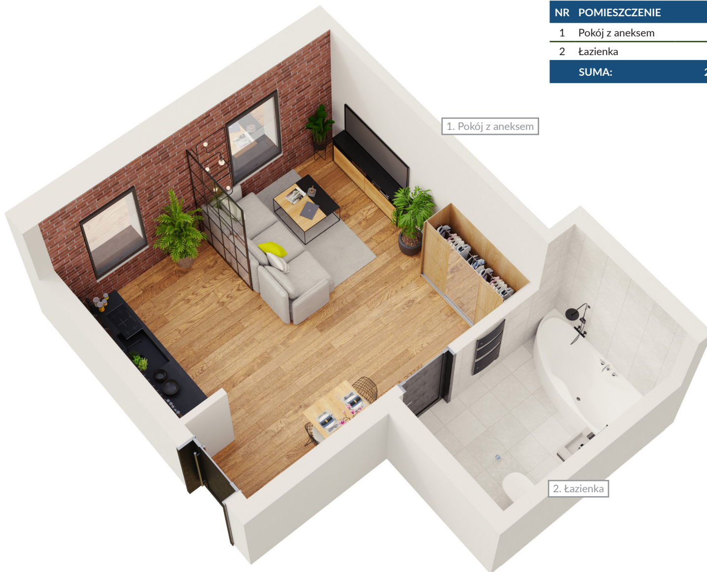
1. Pokój z aneksem